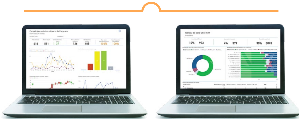
Exemples d'affichage dans Microsoft Power BI